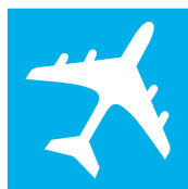
Luft- und Raumfahrt